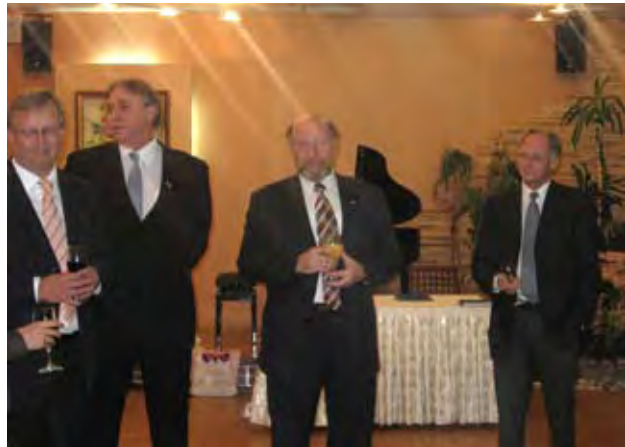
Delegasjon til Nizjnij Novgorod, oktober 2007

10 næringslivsrepresentanter deltok på reisen til Nizjnij Novgorod. Oppfølging med bedriftsbesøk fra Nizjnij Novgorod til Norge finner imidlertid sted i 2008. NRHK vil arbeide for økt kontakt med regionen i årene fremover.