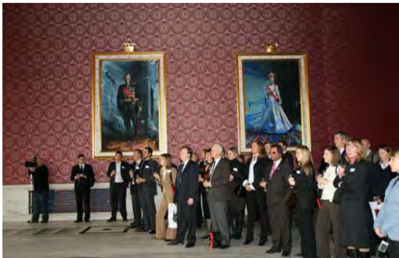
St. Petersburg-næringslivsseminar, november 2007

Seminaret fant sted i Oslo Rådhus som ga en solid og vakker ramme for både besøket og se-