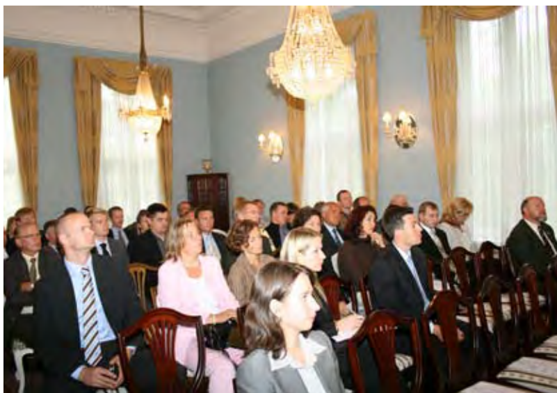
NRHKs nettverksmøte i Den russiske ambassade, august 2007