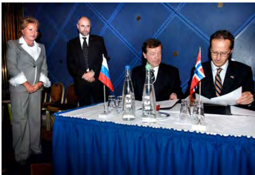
Signering av avtalen mellom NRHK og St. Petersburg handelskammer.

I løpet av de etterfølgende årene er det inngått samarbeidsavtaler med mange regionale handelskamre i Russland særskilt i det Nordvestlige distrikt, Moskva med omland.